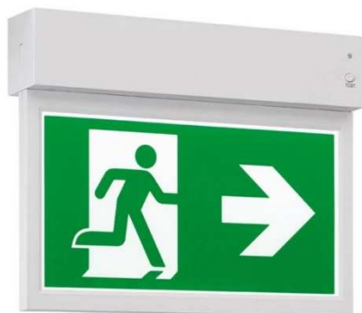
PICTOLIGHT 1P-W/C (Wall/Ceiling)