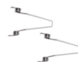
Verenset voor inbouw WAX480-LED WAX480A-LED