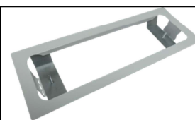
Inbouwkit WAX8-3-M-LED WAX 20NPHA-LED WAX20PHA LED